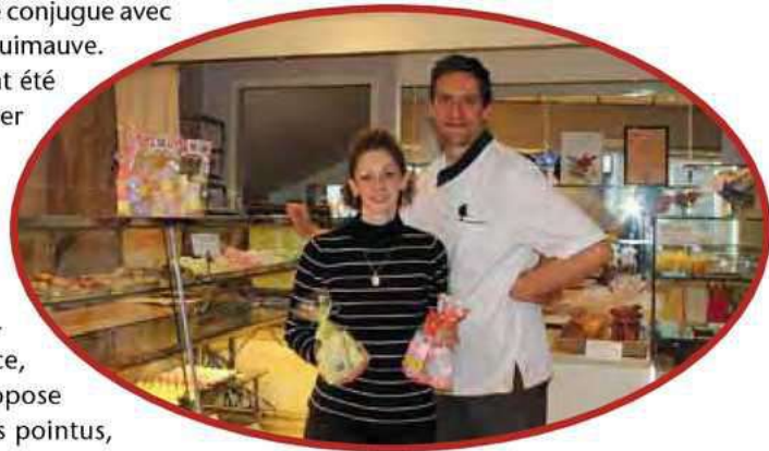
Pâtisserie Barry 39, rue Nationale 04 94 63 02 92

De quoi se régaler avant, pendant et après la fameuse « trêve des confiseurs ».