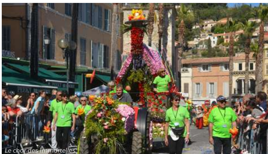
Le char des Immortelles