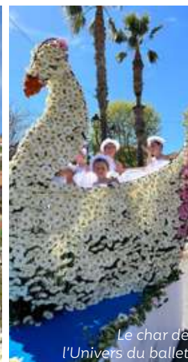
Le char de l'Univers du ballet