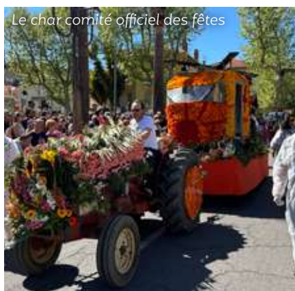
Le char comité officiel des fêtes