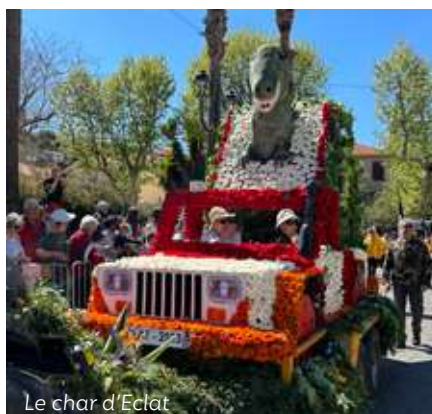
Le char d'Eclat