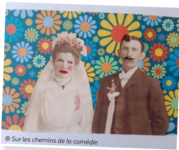
© Sur les chemins de la comédie

Réservations : 06 95 27 12 95 (gratuit moins de 12 ans).