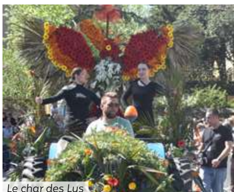
Le char des Lys