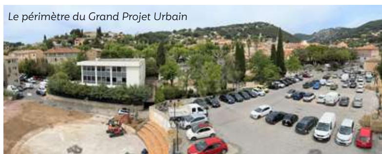
Le périmètre du Grand Projet Urbain

Téléchargez les emplacements des espaces de stationnement et les différentes zones bleues sur le site www.olioules.fr .