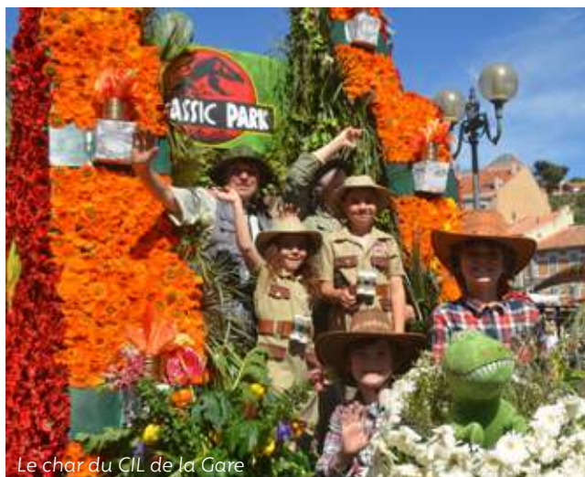
Le char du CIL de la Gare

Depuis 1987 la ville d'Ollioules a renoué avec la tradition du corso fleuri et de sa bataille des fleurs. Pour sa 32 e édition, et sous un soleil éclatant, la manifestation a rassemblé des milliers de spectateurs en cœur de ville. Dans une ambiance mêlant rires, sourires et confettis, les 3 tours de circuit ont permis au public d'admirer 7 chars réalisés par le Comité Officiel des Fêtes, Eclat, Les Immortelles, le CIL de La Gare, l'Univers du ballet, Les majorettes Les Lys d'Ollioules et les élus du conseil municipal sans oublier la voiture officielle, le tout étant décoré uniquement avec des fleurs fraîches d'Ollioules et du Var. Au fil du passage du cortège, agrémenté de la présence des groupes de musiques, fanfares et danseuses brésiliennes, chacun a pu découvrir tous les détails de décoration et imaginer les dizaines de petites mains nécessaires pour piquer les fleurs. Mais avant cela il y a eu aussi la création des structures avec simplement de la ferraille, du grillage, une immense énergie et beaucoup d'imagination. Alors bien sûr rien ne peut exister sans la présence du public et sa confiance à chaque fois qu'il est invité à une manifestation mais en votre nom à toutes et à tous nous disons simplement MERCI à toutes celles et tous ceux qui ont permis à ce 32 e corso fleuri d'être un immense succès populaire.