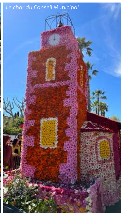
Le char du Conseil Municipal