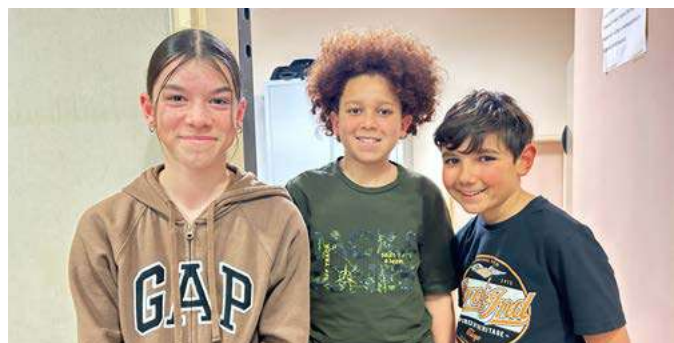
Les collégiens ayant recyclé les ordinateurs

+ de 2 000 ordinateurs donnés dans l'académie de Nice