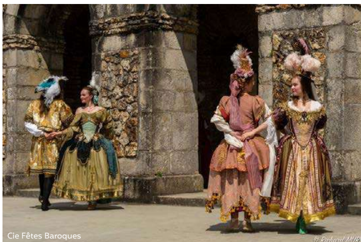
Cie Fêtes Baroques